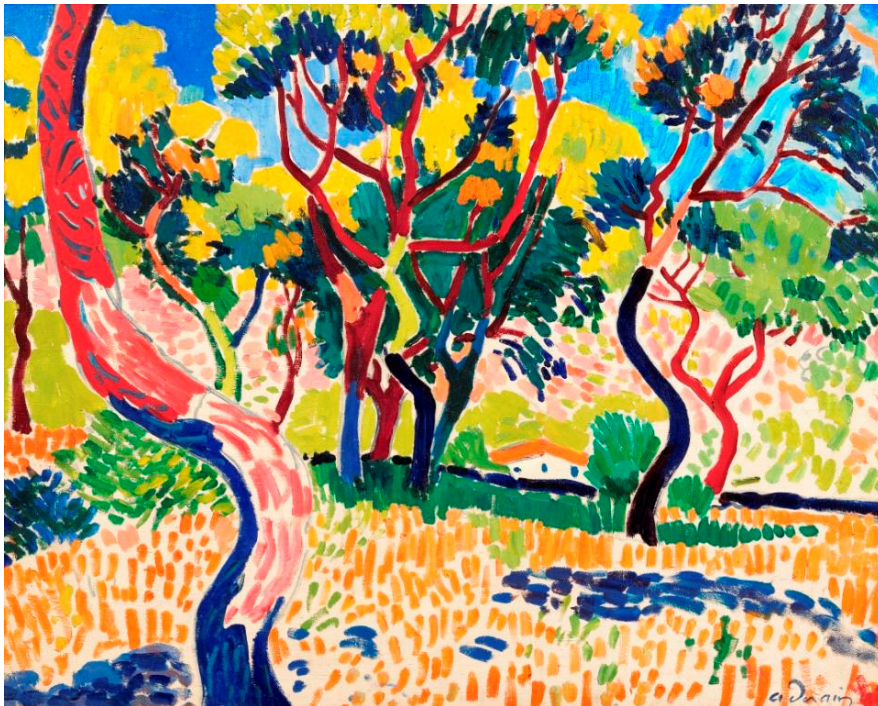
André Derain, Arbres à Collioure , 1905, est: £9-14m / €10-15m

A cette occasion, la Galerie Charpentier sera entièrement réservée pour cet hommage rendu à Vollard