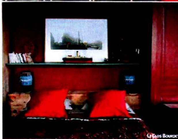
LE LOS BOURGET