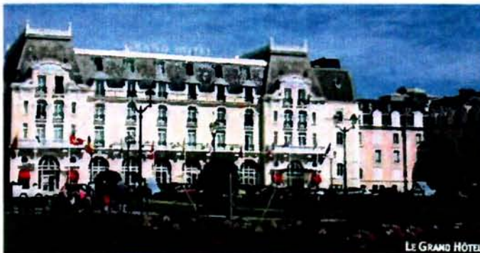
LE GRAND HÔTEL