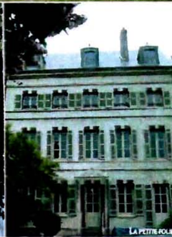
LA PETITE FOLIE