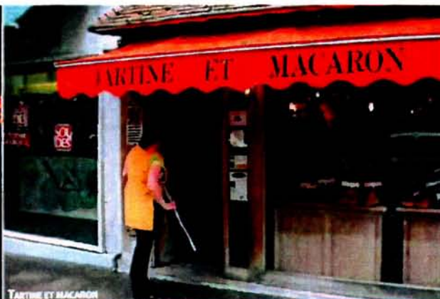
TARTINE ET MACARON