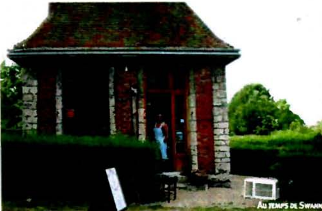
AU TEMPS DE SWANN