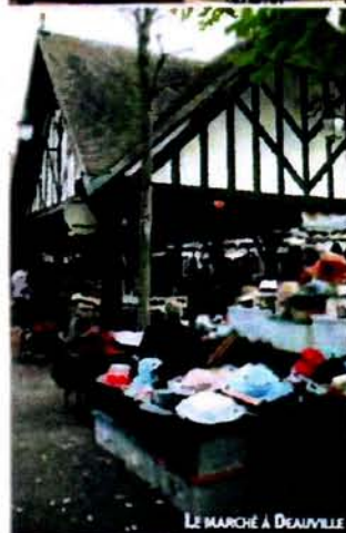
LE MARCHÉ À DEAUVILLE