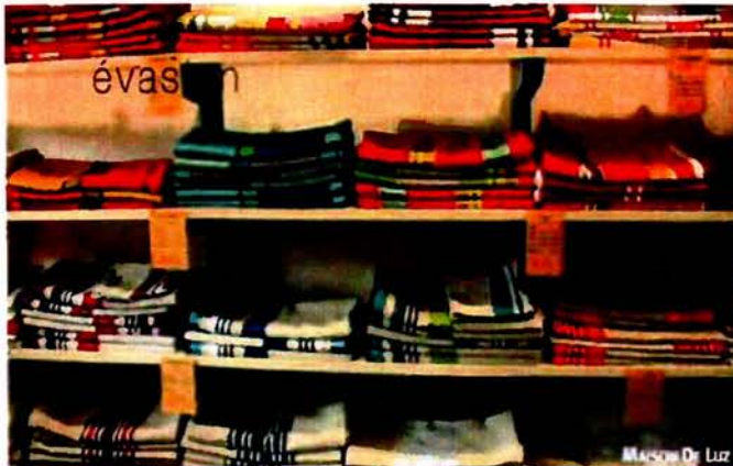
MAISON DE LUZ