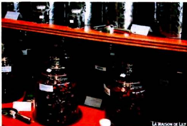
LA MAISON DE LILY