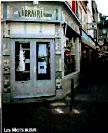
LES MOTS BLEUS