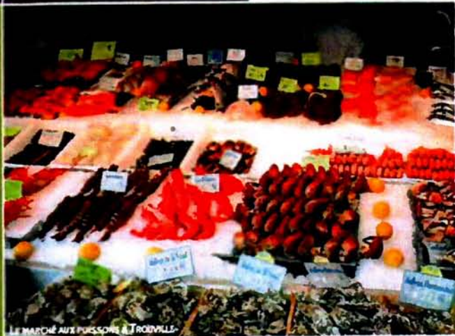
LE MARCHÉ AUX POISSONS À TROUVILLE

Si Deauville est la star incontestée de la côte, avec son casino, ses palaces, son festival du film américain et ses Porsche "m'as-tu-vu" à la douzaine, elle est aussi la sœur siamoise d'une station plus discrète: Trouville. Ainsi, avons-nous décidé de ne pas dissocier ces deux figures normandes qui se complètent, mais qui tout oppose, l'une ayant un éclat tapageur, l'autre évoluant dans le charme de la discrétion, mais chacune ayant un attrait propre... et tout simplement irrésistible.